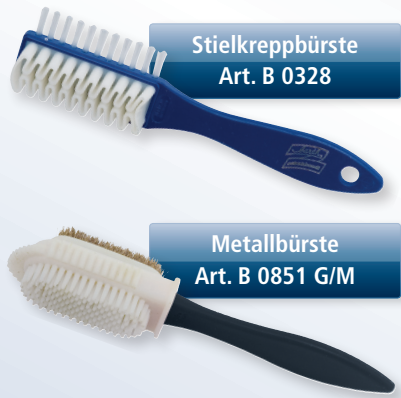
Metallbürste Art. B 0851 G/M