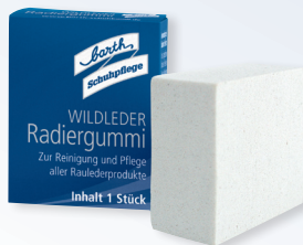
Wildleder Radiergummi Art. P 8500