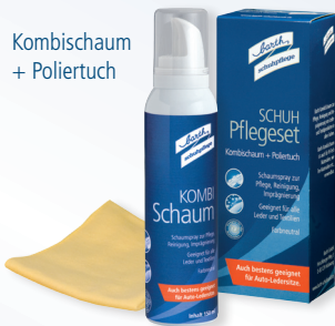
Schuh Pflegeset Art. P 8601