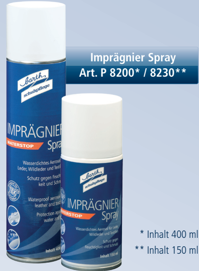
Imprägnier Spray Art. P 8200* / 8230**

Um Fußgerüchen vorzubeugen empfehlen wir Ihnen unser Barth-Fußdeo Spray und eine unserer Barth-Einlegesohlen mit Aktivkohlefilter.