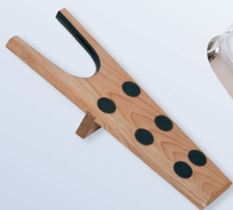
Stiefelknecht Art. S 5400

Barth-Holzschuhspanner nehmen zudem die Feuchtigkeit aus dem Schuh auf.