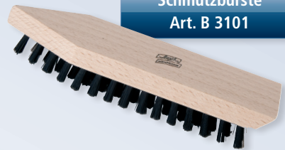
Schmutzbürste Art. B 3101