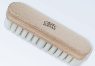
Handkreppbürste groß Art. B 3400