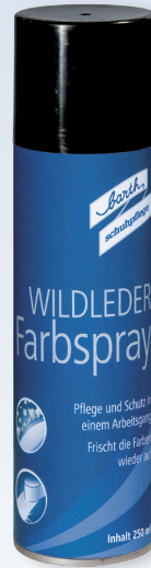
Wildleder Farbspray Art. P 8250

Weitere hochwertige Barth-Pflegemittel und -bürsten finden Sie im gutsortierten Fachhandel.