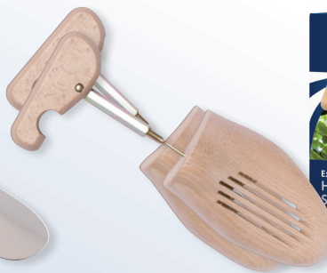
Holz-Schraub-Spanner Art. S 5420