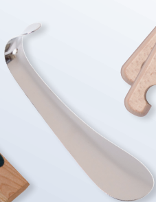
Schuhlöffel Art. L 7963