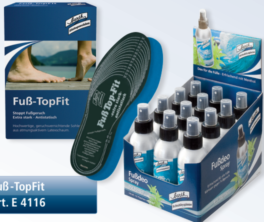
Fußdeo Spray Art. P 8810